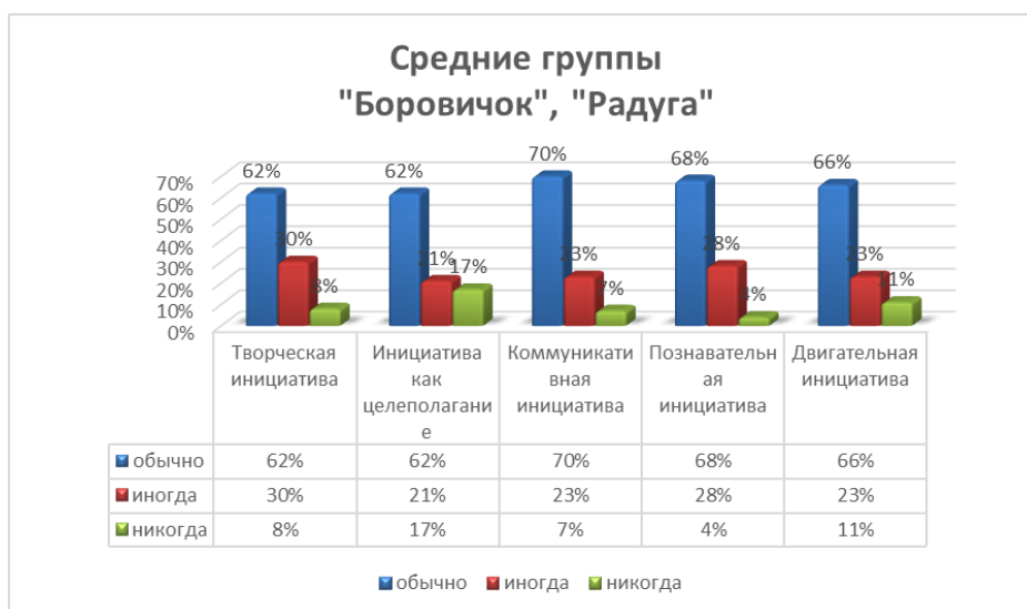
Диаграмма показывает, что проявление всех видов инициатив в основном «нормативно».